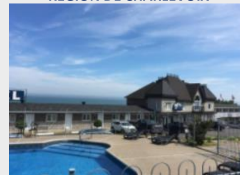
MOTEL VUE BELVEDERE**sup