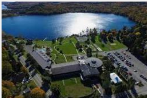
MANOIR DU LAC DELAGE***