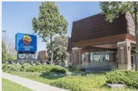
COMFORT INN LUNDRY'S LANE ** sup