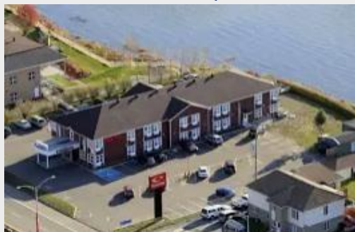
SLEEP INN & SUITES QUEBEC CITY EAST**sup