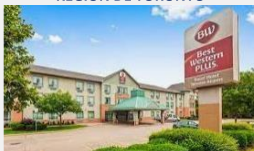
BEST WESTERN PLUS TORONT AIRPORT HOTEL***