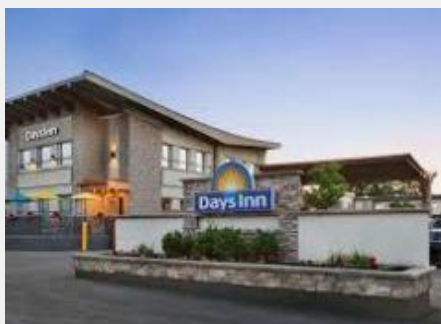
DAYS INN MONTREAL EST**sup