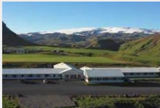
HOTEL DYRHOLA EY