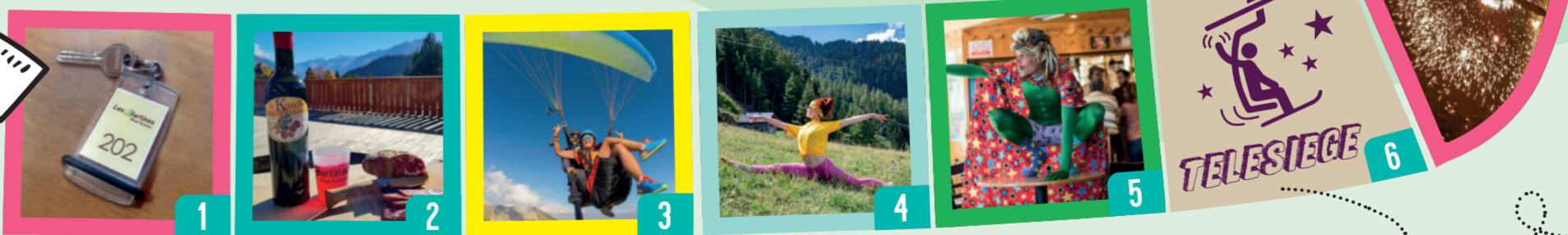
POT D'ACCUEIL !