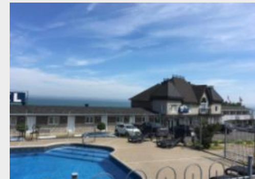
MOTEL VUE BELVEDERE**sup