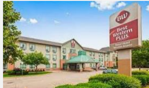
BEST WESTERN PLUS TORONT AIRPORT HOTEL***