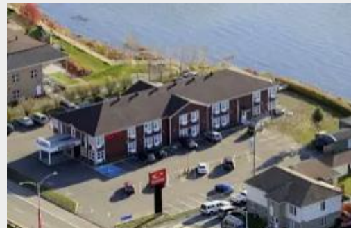
SLEEP INN & SUITES QUEBEC CITY EAST**sup