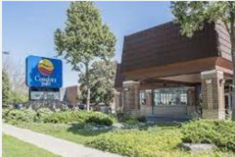
CONFORT INN LUNDRY'S LANE ** sup